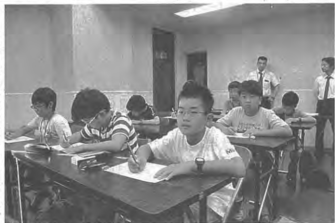
スライドに映された問題を真剣な表情で解く子どもたち=津市広明町のeisu津駅前校で

6年生の生徒や保護者ら約50人が参加した。他にも、縦、横、斜めに玉を直線上に並べて競うパズルゲーム「立体四目」に参加者たちが挑戦した。